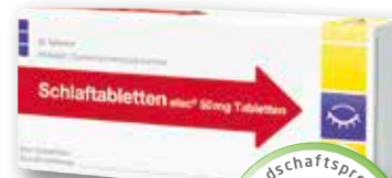
Schlaftabletten elac® 20 Tabletten