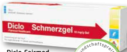
Diclo-Faired Healthcare Schmerzgel 10mg/g 100 g, 1 kg = € 99,90