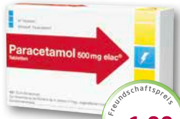
Paracetamol 500 mg elac® 20 Tabletten