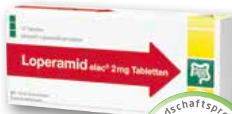
Loperamid elac® 2 mg 10 Tabletten