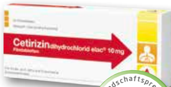
Cetirizin elac® 10 mg 20 Filmtabletten