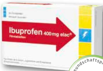
Ibuprofen 400 mg elac® 20 Filmtabletten