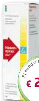
Nasenspray elac® ohne Konservierungsstoffe 10 ml, 1 l = € 24,90