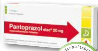
Pantoprazol elac® 20 mg 14 Tabletten