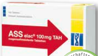
ASS-elac® 100 mg TAH 100 magensaftresistente Tabletten