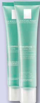
La Roche-Posay Hydrhase HA Creme leicht oder reichhaltig