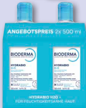
BIODERMA Mizellen-Reinigungs-lösung DUO

1 l = € 499,50 PZN 20175865 / PZN 20175859