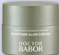
Doctor BABOR MICROBIOMIC Moisture Glow Cream