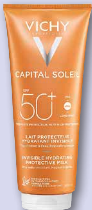
Vichy Capital Soleil Sonnenschutz-Körpermilch SPF 50+