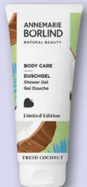
Annemarie Börlind Body Care Duschgel Fresh Coconut