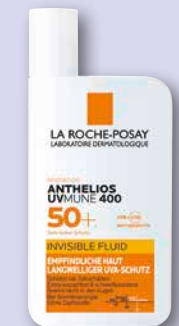
La Roche-Posay Anthelios UVMune 400 Invisible Fluid LSF 50+