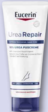
Eucerin® Urea Repair 10% Urea Fußcreme