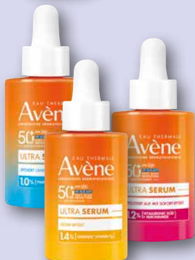
Avene Ultra Serum Aufpolsternd oder Glow-Effekt oder Feuchtigkeit SPF 50+